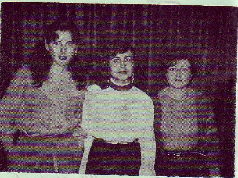
REINA Y DAMAS DE HONOR