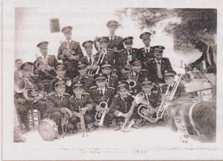
Figura 4: Banda de Música de Villargordo en San Marcos (1958).