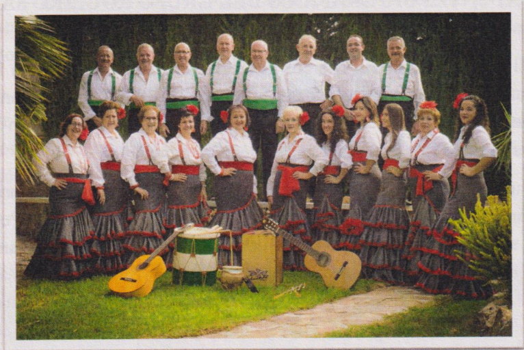
Figura 2: Grupo Rociero San Marcos.