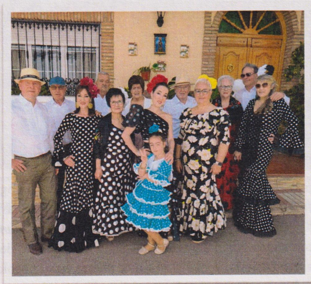
Figura 3: Grupo Rociero San Marcos.