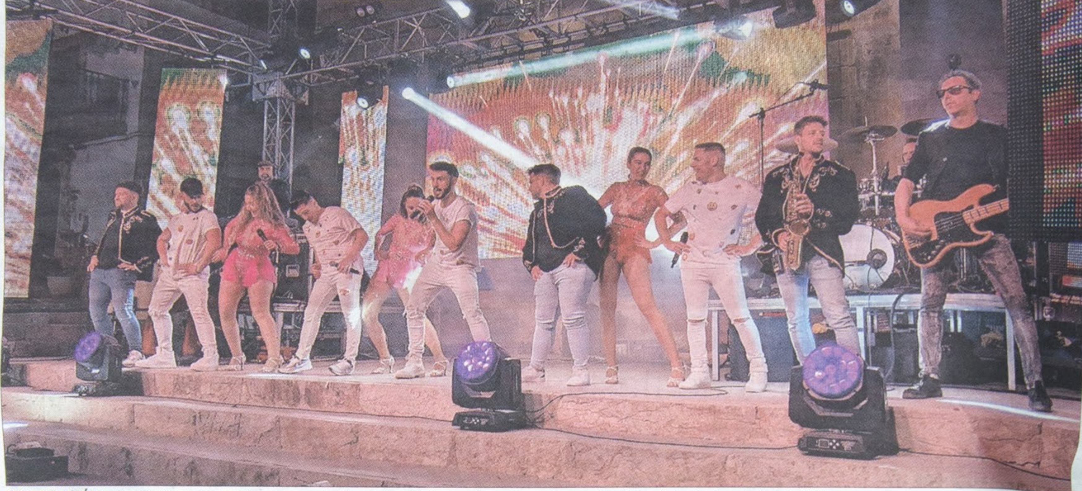
CELEBRACIÓN. La Gran Rocket durante un momento de su actuación la pasada noche en Torrequebradilla ante la atenta mirada del público.